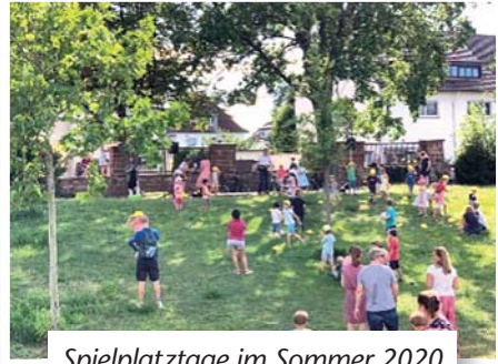
Spielplatztage im Sommer 2020

Besonders in Erinnerung sind auch die Spielplatztage, die wir im Juli letzten Jahres auf dem großen Spielplatz in Knielingen 2.0 gestalten konnten.