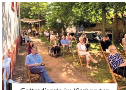
Gottesdienste im Kirchgarten

Besonders die Gottesdienste im Kirchgarten haben wir im vergangenen Sommer sehr genossen. Hier konnten wir mit Abstand tatsächlich auch in größerer Anzahl versammelt sein und unter der Maske sogar singen. Und als das nicht mehr ging, haben Vorsänger/innen musikalisch mitgewirkt.